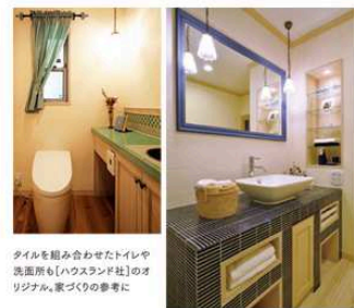
タイルを組み合わせたトイレや洗面所も「ハウスランド社」のオリジナル。家づくりの参考に

暖かな土間スタイルの暮らしが叶えられる。 「リフォームに耐え得る古民家をお持ちの方は、ごく限られる家」と思いますが、こうした土間スタイルの家は新築でもリフォームでも取り入れることができます。どんな内装でも対応できますので、ぜひご相談ください。そう話すのは「ハウスランド社」のスタッフたち。 確かに、「風のくら」には和風からプロヴァンス風、ヨーロッパアンティーク風など、様々な雰囲気の間がある。それぞれに造作家具も設えられている。設計からインテリアコーディネーターまですべて女性スタッフがこなしている。暮らしやすさ、使いやすさに徹したアドバイスももらえるのが頼もしい。最後に「ハウスランド社」の場合、手間請下請とは無縁の専属の自社大工職による万全の施工体制をとっており、建築主には何より安心だ。