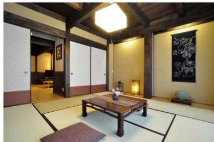
客間や茶の間など柔軟に使える和室は純和風の設え。丁寧な仕事で細部にも見て取れる