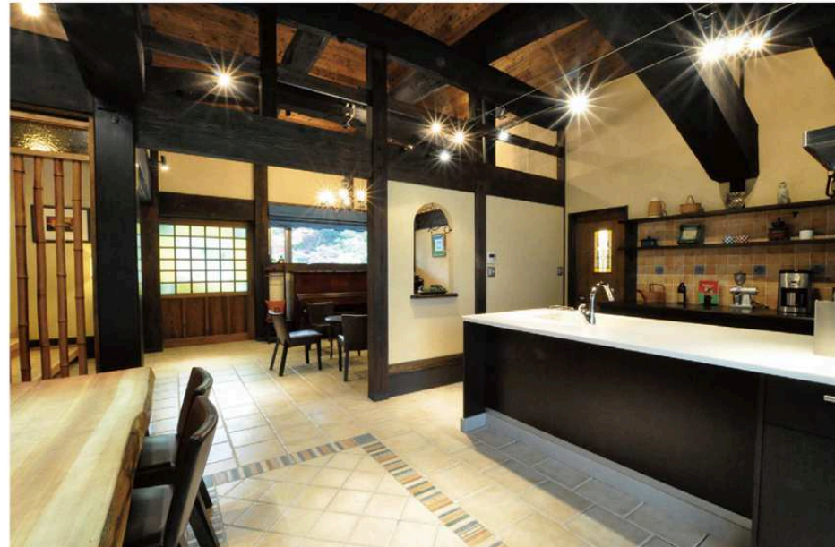
パブリック空間でもある土間と茶の間や個室などのプライベート空間の間に内玄関を設けると、カフェやギャラリーのような雰囲気