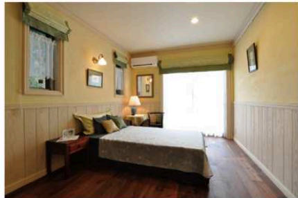
ボタニカルアートが似合いそうなナチュラルかつエレガントな寝室