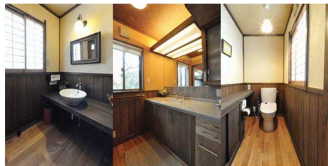
内障子からの柔らかい光が美しい水回り