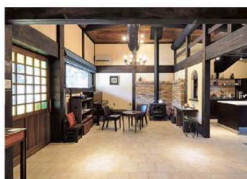
モデル住宅 福岡県筑紫野市大字山口 2122 「風のくら」 ☎092-555-5530 www.kazekura.com