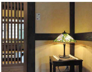
随所にディスプレイしてある和の小物も見所のひとつ