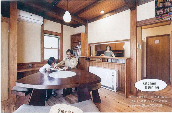
Kitchen & Dining

トイレの扉は杉の無垢材仕上げ。洗面コーナーの壁は高圧洗浄機で簡単に汚れが落ちる。どちらも車椅子でも使いやすいリアフリー設計