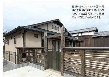
屋根のないシンプルな冠木門はご夫婦のお気に入り。「ハウズランド社」と言えばコレ。絶対に付けて欲しかったんです」

伝わってきて、それはちょっとした雑談の中からも感じられ、この会社なら信頼できると確信しました。家づくりを進めるにつれて、築年数が40年以上経過して老朽化が進んでいたこと、改装に新築同様の費用がかかることが判明し、建て替えをする方向に切り替えた。最初の相談から家の完成まで、費やした期間は約2年。何度も打ち合わせや図面の書き直しに対応してくれた「ハウズランド社」には感謝しきりだご夫婦は話す。