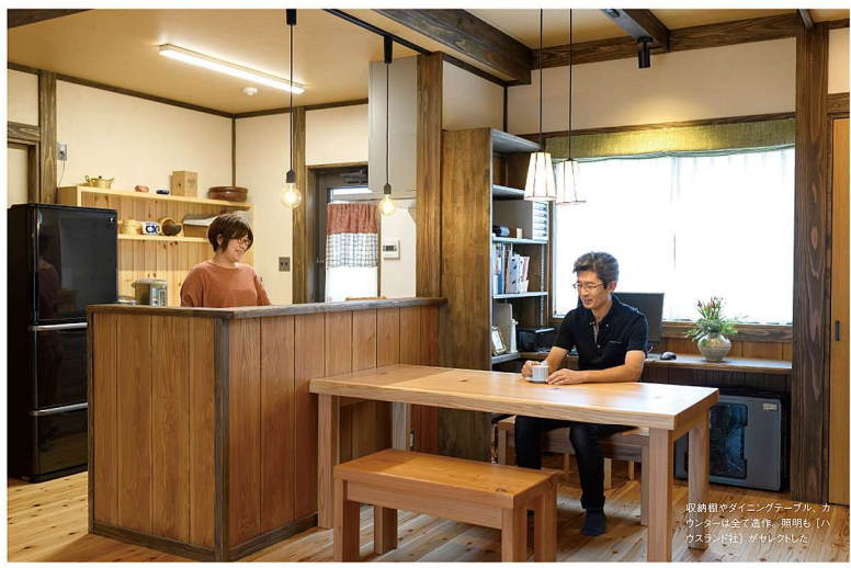
取材担当がインテグラル・カスタマーは全てを、照明も「ハウズランド社」がインテグ

暮らしのメインとなる、大きな吹き抜けのLDK。柱や梁は自然素材で深めのブラウンに塗り、空間にメリハリを加えた